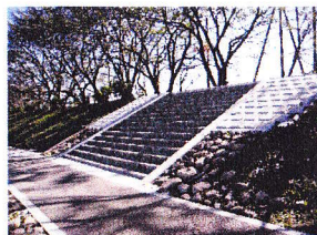
既存市道を活用した歩行者動線