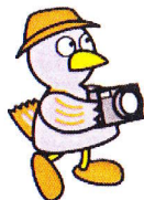
憩いの広場ゾーン